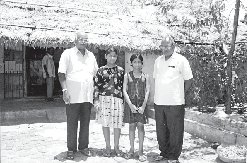
కవి వృద్ధాప్యంలో నివసించిన ఇల్లు సుతాహాట్, కటక్