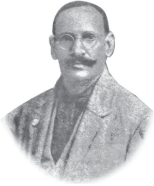
రాజా మంత్రిప్రగడ భుజంగరావు బహదూర్