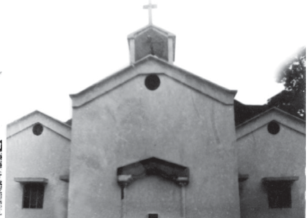
దాస్ అంతర్వేది పురుషోత్తము మెమోరియల్ హాల్, పర్లాఖిమిడి (కొత్తది)