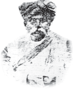
మాదాబత్తుల బ్రహ్మగిరి చిట్టివలసలో కవిగారిచే బాప్టీస్మము తీసుకొన్న వ్యక్తి