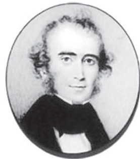
వార్డ్లా దొరగారు (విశాఖపట్నంలో కవియొక్క సహచరి సువార్తికుడు)