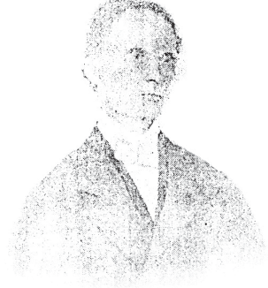
జె.డబ్ల్యూ. గోర్డాన్ కవియొక్క సహచర సువార్తికులు